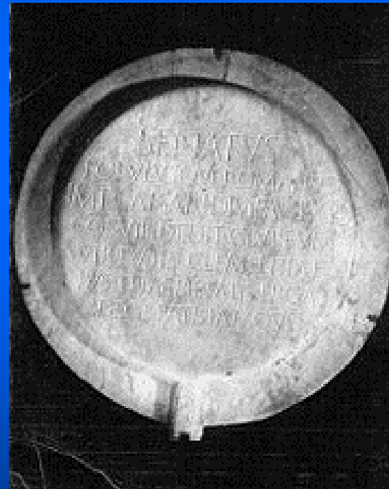
Arles: copia in marmo dello scudo d'oro offerto dal Senato ad Augusto. Vi sono incise le virtù ad egli riconosciute: Iustitia, Pietas, Clementia, Virtus