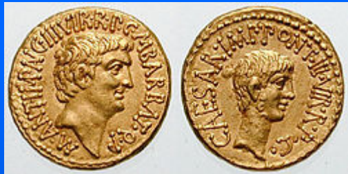
Aureo raffigurante Antonio ed Ottaviano