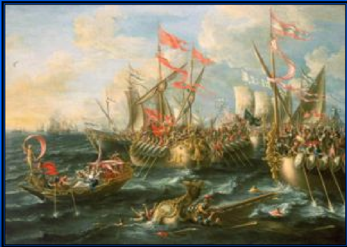
La battaglia di Azio secondo Lorenzo A. Castro (1672)